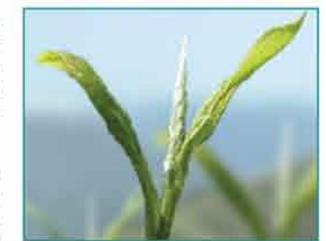
Weißer Tee, der Tee der chinesischen Kaiser, wirkt effektiv gegen Freie Radikale.

Mit dem Anti-Blemish Roll-On bietet NEOVITA COSMETICS eine Soforthilfe gegen Pickel zur lokalen Anwendung. Der enthaltene Vollpflanzenauszug aus Hamamelis adstringiert und kräftigt die Haut und lindert vorhandene Entzündungen. Natürliche Heilerde unterstützt die Wirkung.